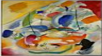
Improvisation 31 (Sea battle)